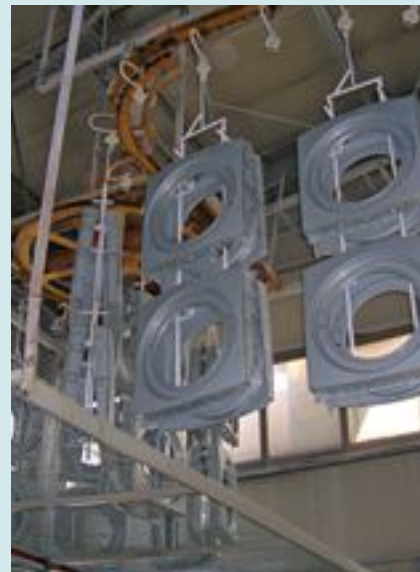
Mit „Interlox 5705“ beschichtete Waschmaschinenkomponenten vor dem Pulvern.