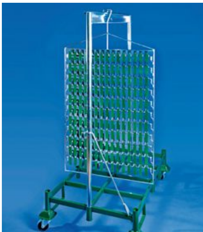
Ausgeklügelte Gehängesysteme sparen Arbeitsschritte ein und erleichtern die Aufhängung.

Der erste Ansatz wird stets die Verbesserung des Auftragswirkungsgrads sein. Dies wird im Bezug auf die Aufhängetechnik mit verbesserter und sicherer Erdung der Bauteile und optimierter Ausnutzung der Warenträgerfläche erreicht, also mehr Bauteile pro Zeiteinheit am Pulvergehänge. Dazu sind natürlich viele Einflussfaktoren zu berücksichtigen - wie das Vorbehandlungs- und Applikationsverfahren, die Fördererführung, das Bauteilspektrum und die Losgrößen. Gegebenenfalls lassen sich auch Sonderaufnahmen entwickeln, mit denen Bauteile gleichzeitig maskiert und gehängt werden. Für metrische Innen- und Au-