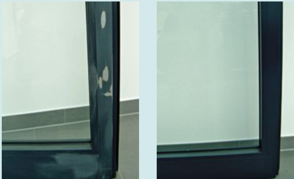
Bei beschädigter Pulverbeschichtung (li.) – wie hier bei einem Türelement – lässt sich durch professionelle Reparatur der Oberfläche der identische Farbton erzielen.

en des Energieaufwands steht nach wie vor im Fokus der Entwicklungen