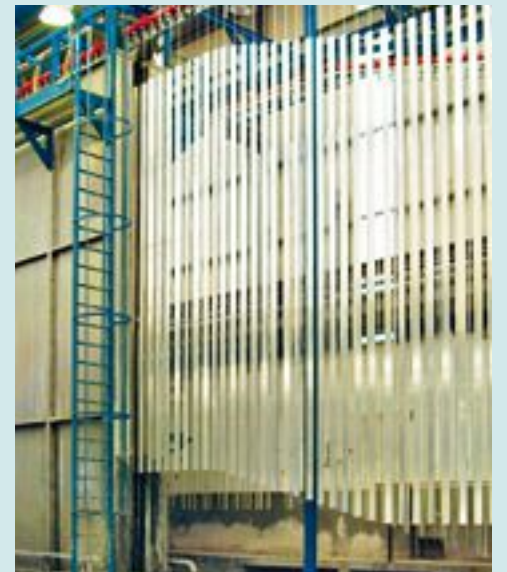
Das moderne Vorbehandlungsverfahren „Iridite EXD“ bewirkt eine sehr gute Lackhaftung und hohen Unterrostungsschutz.

den Bereichen Lackherstellung, Vorbehandlung und Anlagentechnik zurzeit konzentriert und wie die Anwender davon profitieren. Weiterhin legen die Fachleute dar, welche Herausforderungen an eine moderne Pulverlackierung – und damit welche Trends sich aus den steigenden Qualitätsanforderungen der Endkunden ergeben. Die Experten aus dem Sektor Vorbehandlung zeigen zudem